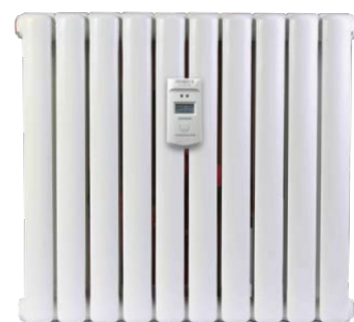
Esempio di installazione Example of installation