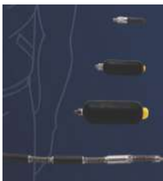
SONDA ATTIVA 33KHz Sonda autoalimentata ad inserzione per rilevazione condutture non metalliche BA.0010.8030