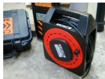
SONDA PASSIVA Cavo semirigido da inserire in tubazioni non metalliche e consentirne il rilevamento immettendo il segnale della trasmittente. BZ.0020.0020 Lunghezza 30m BZ.0020.0050 Lunghezza 50m