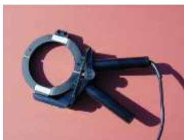
PINZA TOROIDALE 33 KHz Pinza toroidale per immettere il segnale in cavi e tubazioni in modo induttivo