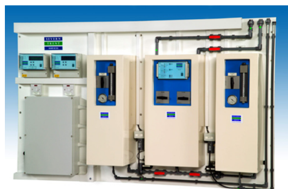
Sistemi di clorazione in servizio/standby