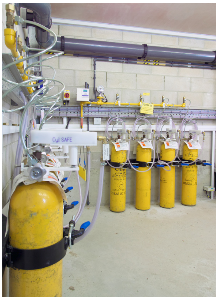
Sistema di sicurezza automatico Cyl-SAFE

La linea Capital Controls® VEGA™ è un sistema di neutralizzazione di eventuali fughe di cloro dai regolatori di vuoto, studiato per affrontare le possibili fughe durante le operazioni di sostituzione delle bombole.