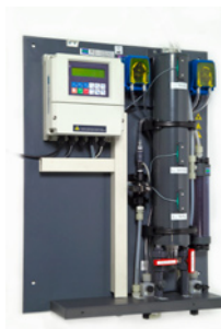
Generatore di biossido di cloro GS4000