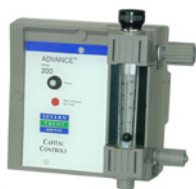
Cloratore Advance® Series 200

L'ampio range di prodotti è in grado di soddisfare ogni richiesta dei clienti, dalla generazione in sito di ipoclorito di sodio, produzione di cloro-gas e generatori di biossido di cloro, fino alle tecnologie per la disinfezione ultravioletta.