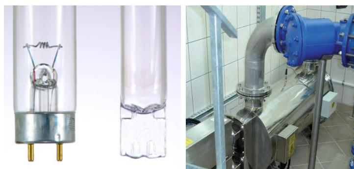
Lampade con elettrodo e senza elettrodo