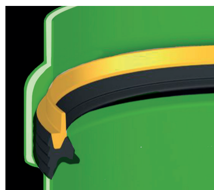
GUARNIZIONE AD ALTE PRESTAZIONI