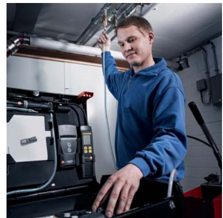
Prova di tenuta su tubazioni per acqua potabile e acque reflue con sensore esterno