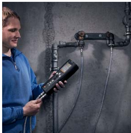
Prova di tenuta senza serbatoio di riempimento gas