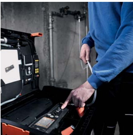
Prova di tenuta automatica con serbatoio di riempimento gas