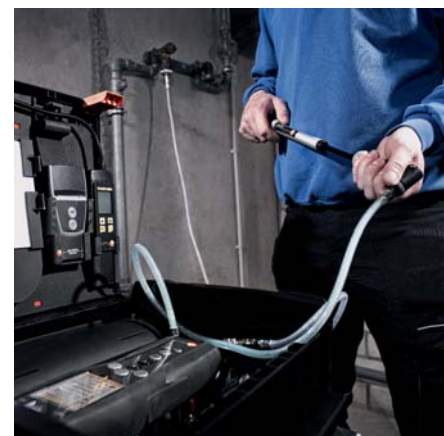
Prova di tenuta fino a 1 bar