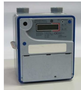
SMART VERSIONE 169 Mhz