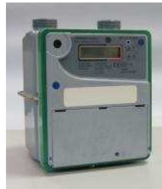
SMART VERSIONE GSM