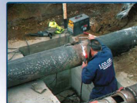
Aeroporto Internazionale Napoli - Capodichino