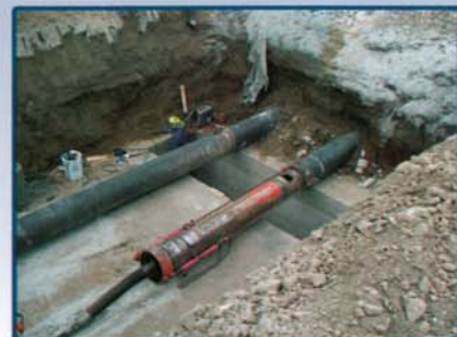
Aeroporto Internazionale Napoli - Capodichino