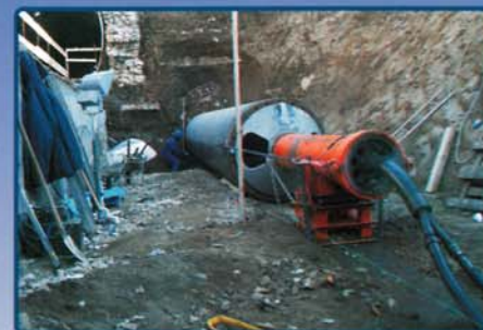
Banca D'Italia Frascati (Rm)