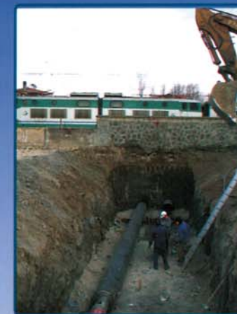
TAV. Roma/Napoli Via Lufrano (Na)