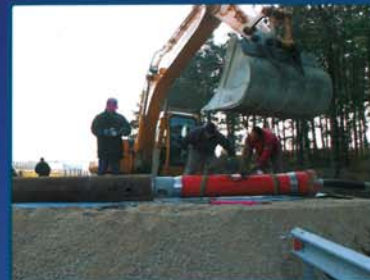
TAV. Roma/Napoli Roccalevandro (Ce)