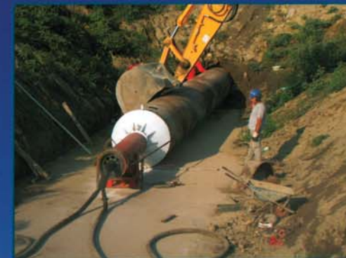
TAV. Roma/Napoli Via Lufrano (Na)