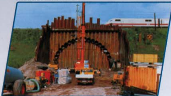
Realizzazione di calotta per sottopasso ferroviario

le. La tecnica - Pipe ramming dispone di adeguate riserve in potenza, p.e. Per percussioni continue o per superare ostacoli estremi.