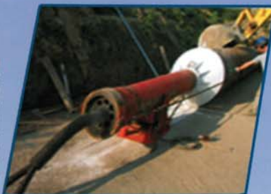
Schema tipo di realizzazione di Pipe ramming

La tecnica Pipe ramming consente di spingere con energia dinamica a percussione, tubi d'acciaio sotterranei. Il tubo d'acciaio aperto in testa lavora come una carotatrice statica e il terreno viene spurgato in un unico ciclo solamente a perforazione ultimata. Il sistema si adatta