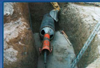
Banca D'Italia Frascati (Rm)