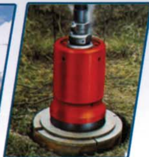
Versatilità della macchina pneumatica utilizzata per infissione tubi e/o palancole in verticale