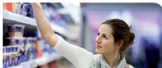
Alimentare e bevande