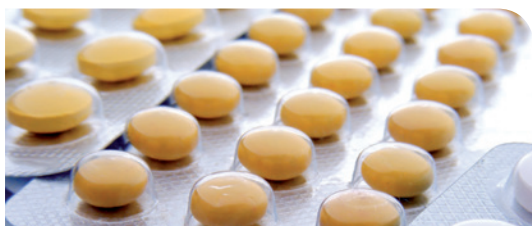
Farmaceutico e biotecnologie

I nostri strumenti con separatore sono adatti per moltissime applicazioni in svariati settori industriali.