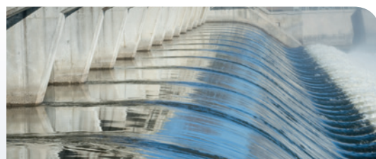
Acque e acque reflue