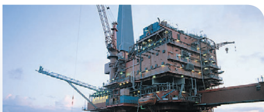
Oil and Gas