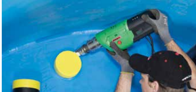
FUSION 1 – maggiore flessibilità durante la saldatura grazie al design snello.

Estrusore manuale con regolazione digitale