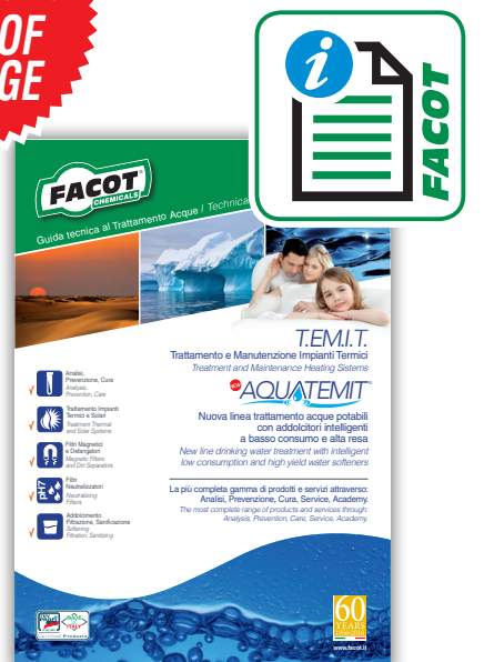
Guida tecnica al trattamento dell'acqua TEMIT + AQUATEMIT®