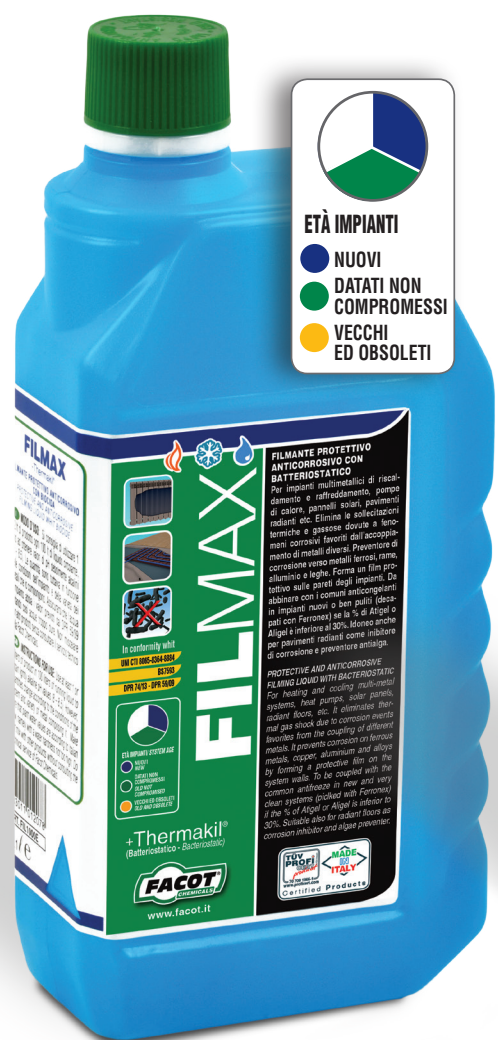
FILMAX + THERMAKIL® Anticorrosivo