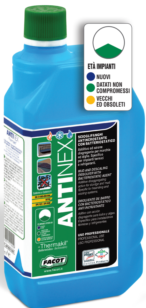
ANTINEX + THERMAKIL® Scioglifanghi