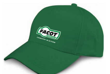
Cappellino baseball Facot