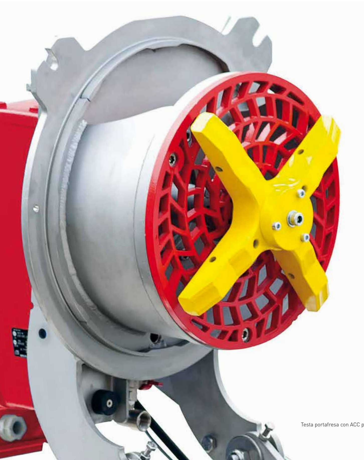
Testa portafresa con ACC plus